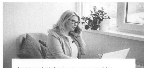
Arnaques téléphoniques : comment les reconnaître?